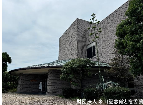
財団法人 米山記念館と竜舌蘭