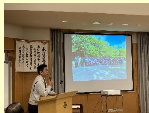
柿田川IRCの川口会員 (柿田川の奉仕活動について)