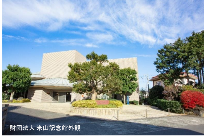
財団法人 米山記念館外観