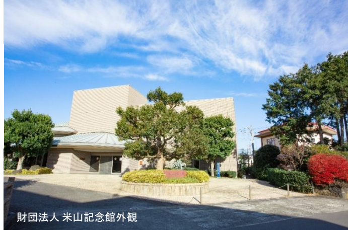
財団法人 米山記念館外観