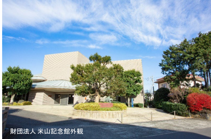
財団法人 米山記念館外観