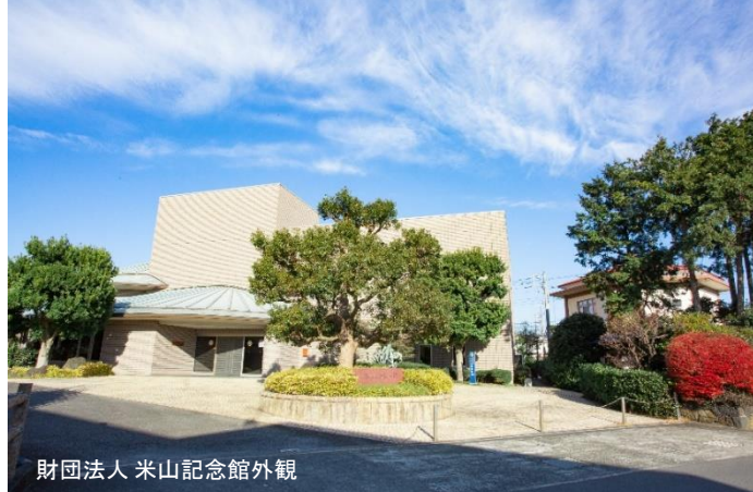
財団法人 米山記念館外観